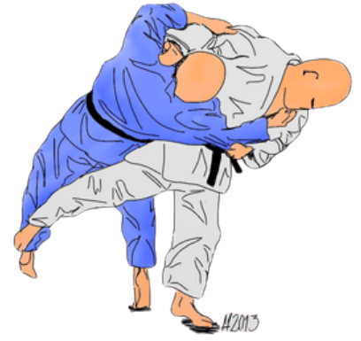
O SOTO GURUMA