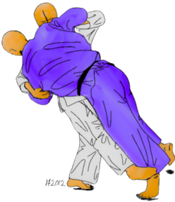
SASAE TSURI KOMI ASHI