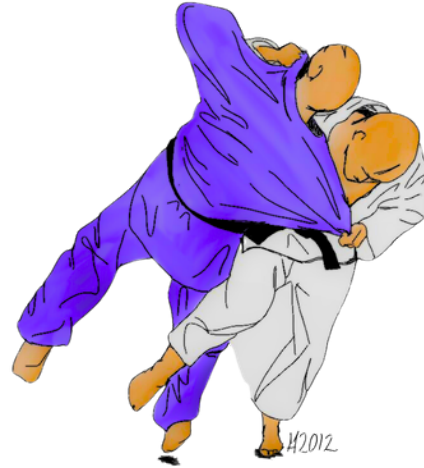
O SOTO GARI