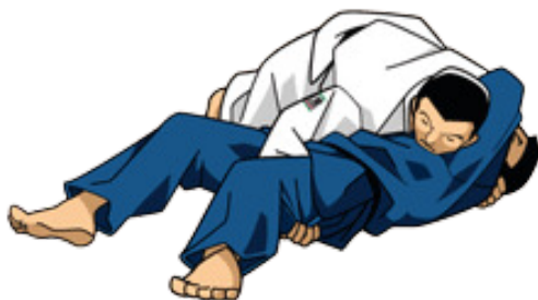
YOKO SHIHO GATAME